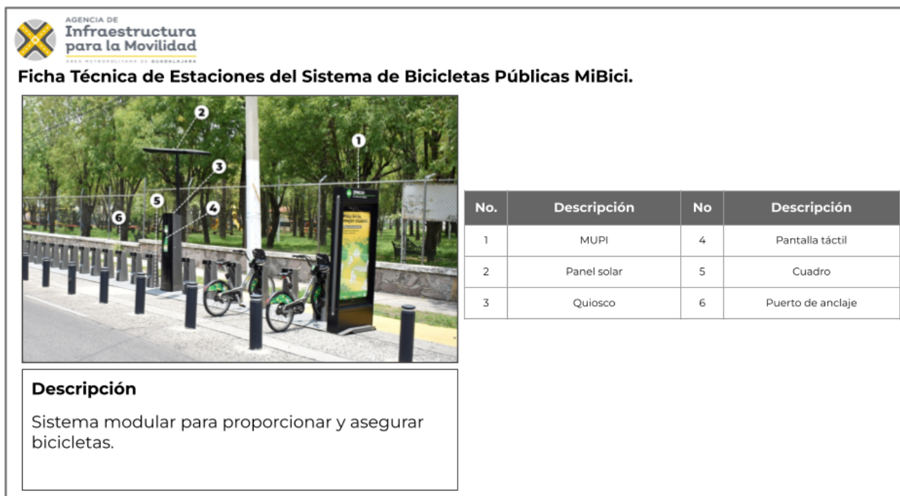
Cuadro 01. Partes que componen las estaciones del Sistema de Bicicletas Públicas MiBici.

La siguiente ficha presenta los principales componentes de la Estación.