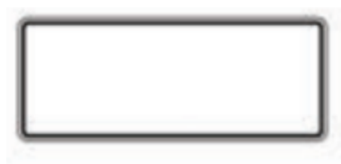
lámina rectangular de 71 x 30 cms con ceja perimetral doblada de 2.5 cms tipo charola con elemento de sujeción soldado a los lados para señalamiento vertical tipo restrictivo